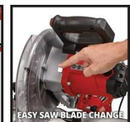
EASY SAW BLADE CHANGE